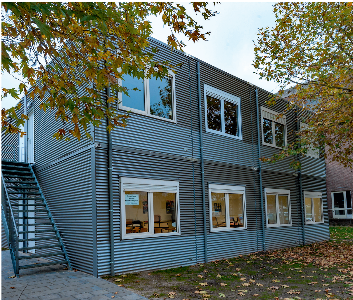
De noodlokalen op het terrein van de school bieden de komende jaren uitkomst.

In afwachting van nieuwbouw – hoogstwaarschijnlijk aan de Bergambachterstraat – heeft de directie van het Schoonhovens College maatregelen moeten treffen om zijn leerlingen tussentijds onderdak te bieden.