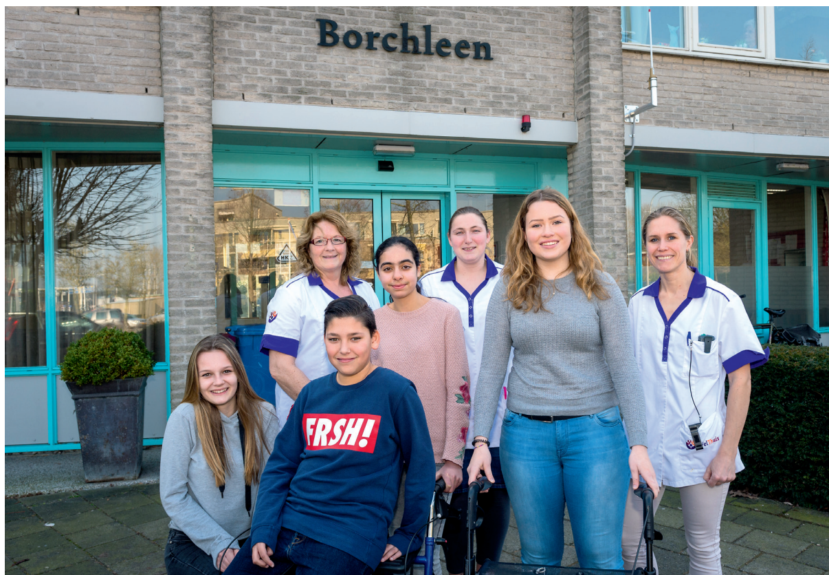
Het bezoek aan Borchleen leverde veel inzichten op voor de jonge zorgverleners.