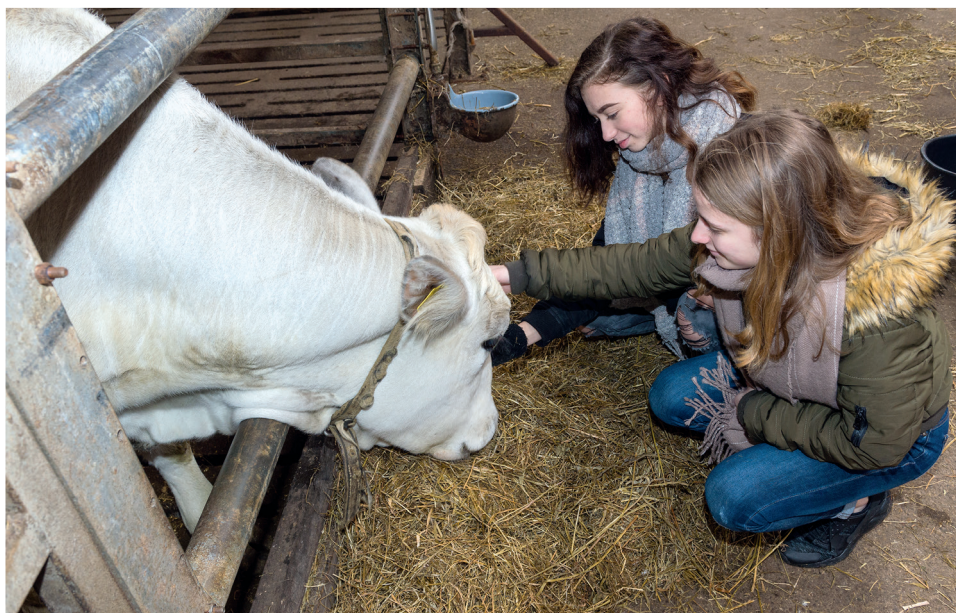
Het bezoek aan de zorgboerderij in Vlist versterkte de band tussen mens en dier.