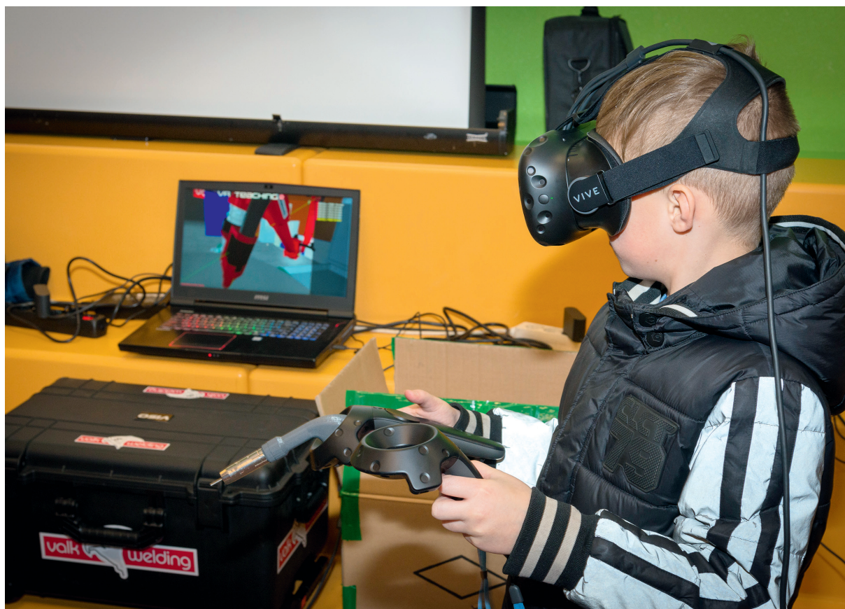
Driedimensionale robottechniek op het Techniekplein.