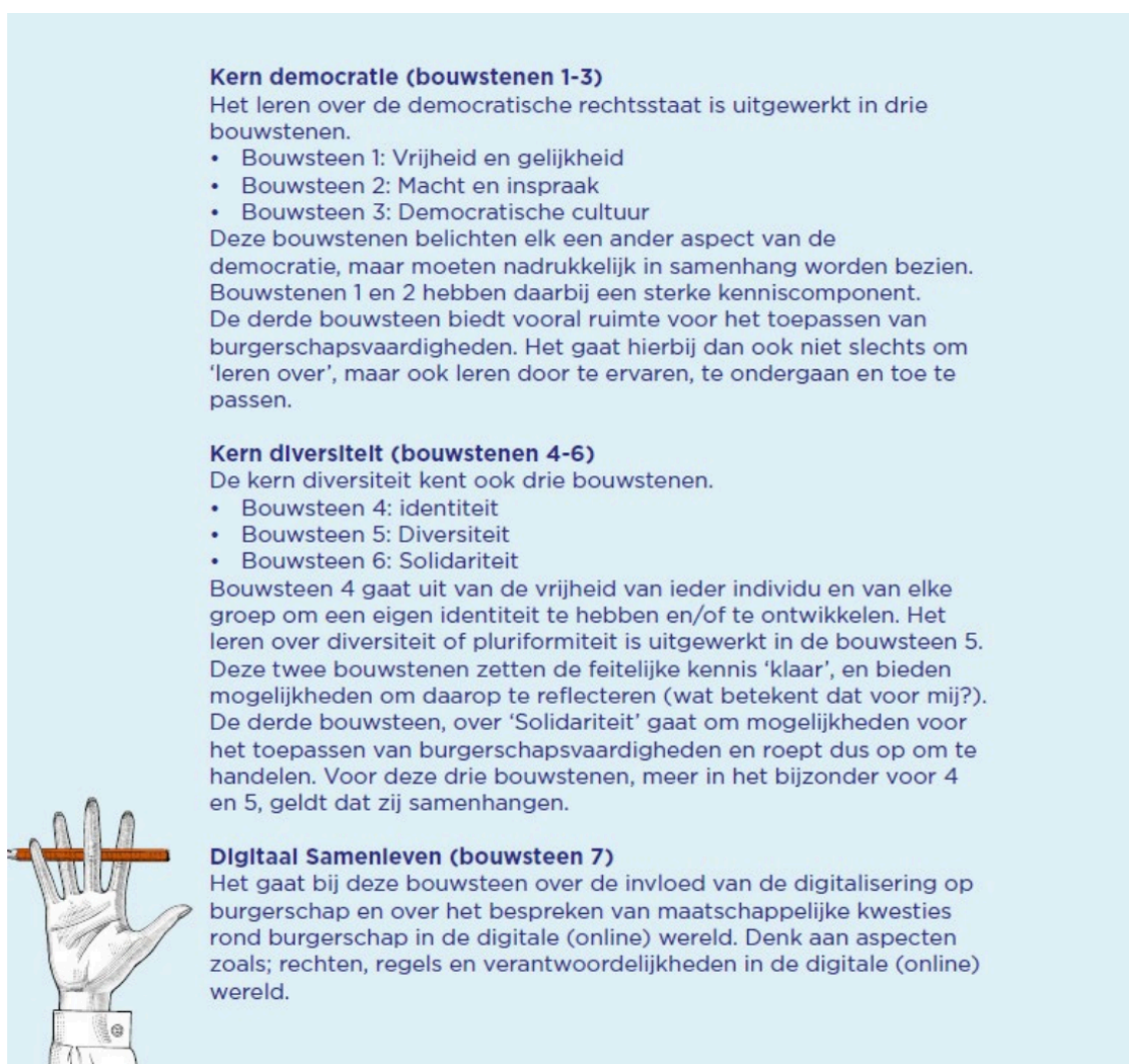
Afbeelding 1 Fragment uit Handreiking burgerschap funderend onderwijs. Doelgericht en samenhangend werken aan burgerschap (SLO, 2021, p. 13).